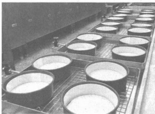
タイではまず、ベークドチーズケーキを生産する