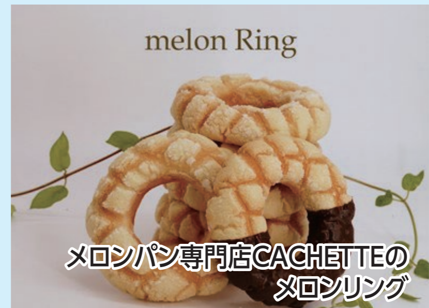
メロンパン専門店CACHETTEのメロンリング